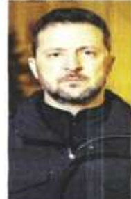
El Presidente de Ucrania, Volodymyr Zelensky.

Horas antes, un vocero de Rusia dijo que pausar la ayuda