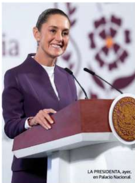
LA PRESIDENTA, ayer, en Palacio Nacional.

UE se solidariza con "aliados próximos", también Chile; Trudeau busca cooperación con mexicanos; estadounidense le advierte sobre más represalias