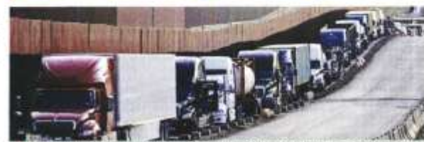
El paso de camiones hacia Estados Unidos se redujo considerablemente, como ocurrió ayer en el Puente de Otay, en Tijuana, Baja California.