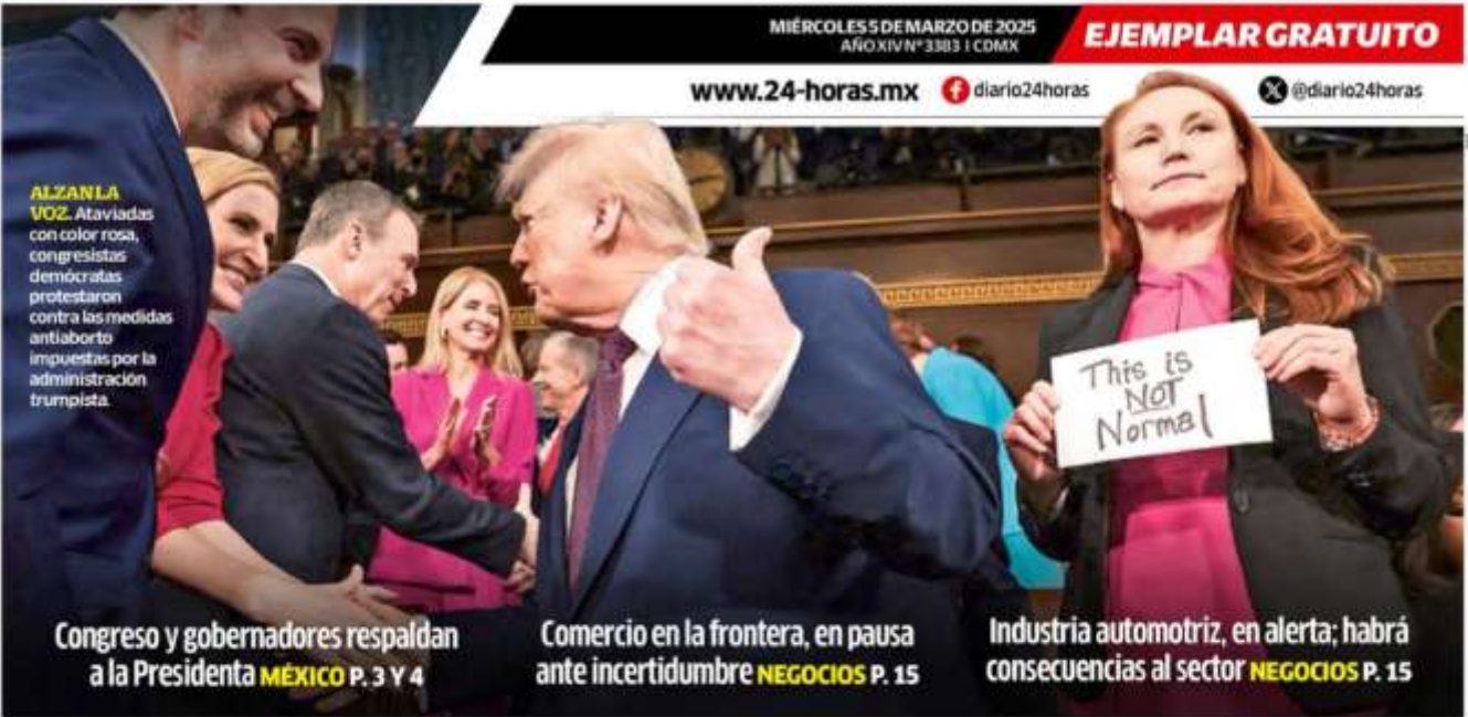
Congreso y gobernadores respaldan a la Presidenta MÉXICO P. 3 Y 4

ALZAN LA VOZ. Ataviadas con color rosa, congresistas demócratas protestaron contra las medidas antiaborto impuestas por la administración trumpista.