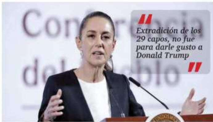
“Apoyar la imposición de aranceles no es muy patriótico”, expresó la Presidenta en “La Mahanera del Pueblo”.

La decisión de Trump retrasará hasta el próximo 2 de abril la imposición de aranceles del 25 % sobre los automóviles que entren a EU procedentes de México y Canadá, luego de que el mandatario platicara con los directivos de las tres empresas fabricantes de autos. PÁG. 6