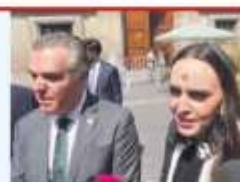
Presencia. La IP acompañará a la presidenta el domingo en el Zócalo.