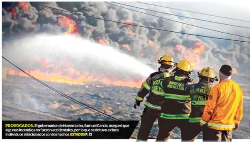
PROVOCADOS. El gobernador de Nuevo León, Samuel García, aseguró que algunos incendios no fueron accidentales, por lo que se detuvo a cinco individuos relacionados con los hechos ESTADOS P. 12