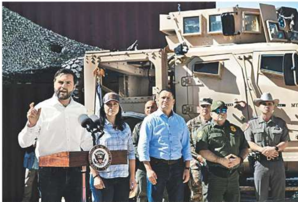
James D. Vance, vicepresidente de EU, habla frente a agentes fronterizos en la zona de Eagle Pass, Texas.