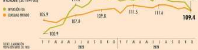
México | Consumo privado y formación bruta de capital fijo | Índices (2018=100)

Diciembre fue el peor mes para el gasto en maquinaria, equipo y construcción de empresas y gobierno, así como el consumo privado, con retrocesos que no se veían desde el año de la pandemia. ● PÁG. 23