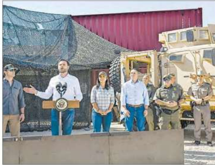
▲ En su visita ayer a la frontera, en Eagle Pass, Texas, acompañado del secretario de Defensa, Pete Hegseth (izquierda), y de la directora de Inteligencia,