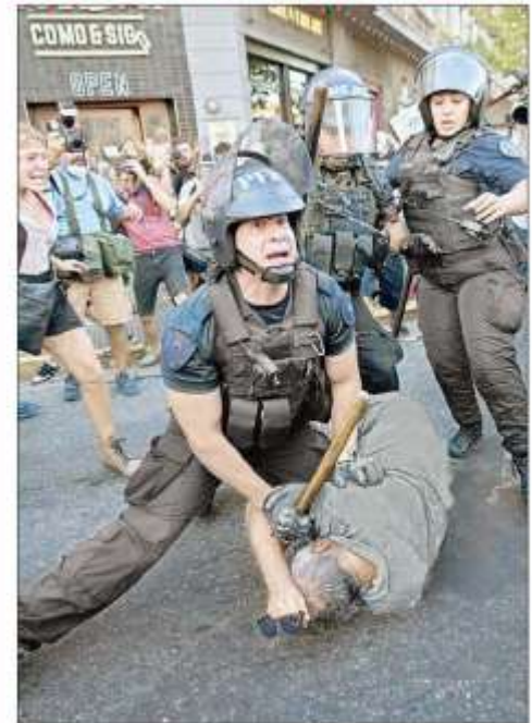
▲ Al tiempo que dos apagones afectaron a más de 3 millones de personas en Buenos Aires en plena temporada de calor, la policía sometió con inusitada