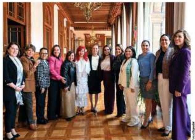
GOBERNADORAS morenistas, ayer, con la Presidenta.