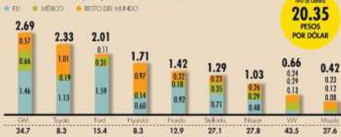
Ventas de autos nuevas por origen de los vehículos, 2024* | MILLONES DE UNIDADES

El año pasado se vendieron en EU 16 millones de vehículos, de los cuales 16.5% fueron construidos en México. El anuncio ayer de la pausa al arancel a ese sector hizo que el peso se apreciara ante el dólar.