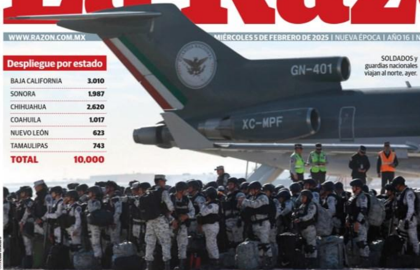
SOLDADOS y guardias nacionales viajan al norte, ayer.