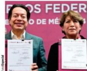
MARIO Delgado y Delfina Gómez, ayer.

LA GOBERNADORA Delfina Gómez y el secretario Mario Delgado firman convenio; buscan declarar al estado libre de analfabetismo. pág. 11