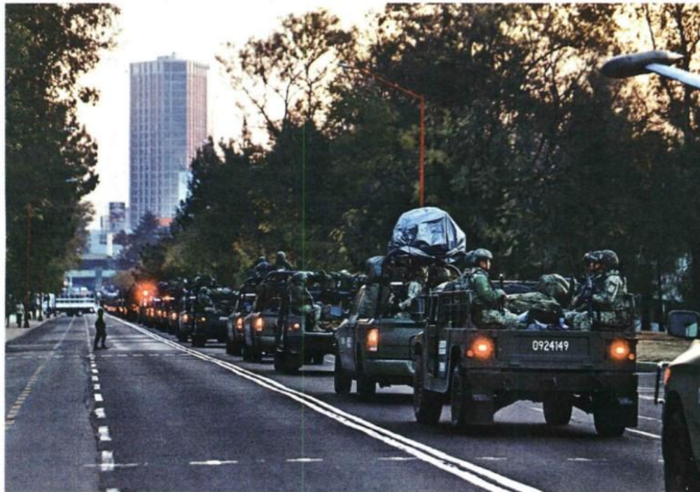
Los miembros de Guardia Nacional y Ejército fueron congregados para partir en el Campo Militar Uno A. JORGE CARBALLO