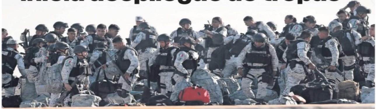
Elementos de la Guardia Nacional arribaron ayer a Ciudad Juárez, Chihuahua, para reforzar la seguridad fronteriza, tras el acuerdo entre los mandatarios de México y Estados Unidos.

Llegan mil 500 elementos de la Guardia Nacional a la frontera norte para contener el paso de migrantes y de fentanilo; la presidenta Claudia Sheinbaum asegura que no deja desprotegido al resto del país