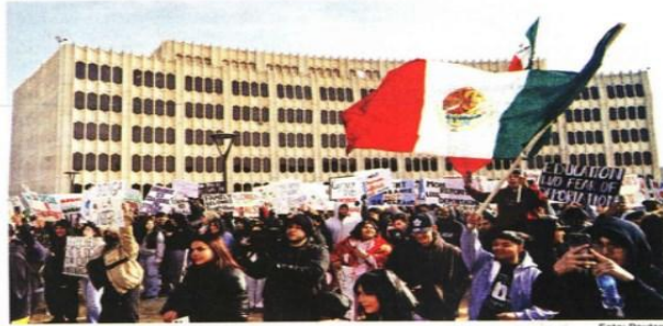
Mexicanos protestaron afuera del Departamento de Educación de Oklahoma contra las redadas que autoridades migratorias de Estados Unidos prevén realizar contra indocumentados en escuelas públicas.