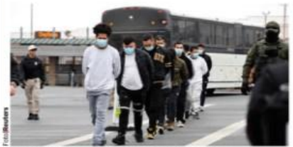
EN TEXAS radicalizan capturas; en la imagen migrantes en fila caminan esposados hacia su deportación, ayer.

CDMX se define como ciudad santuario y va por abrir más albergues; ya revisan espacios para acoger a 500 en cada uno. págs. 6 a 8