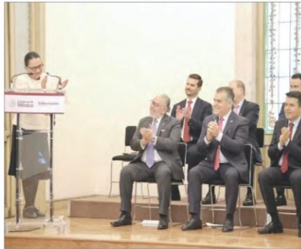
▲ La secretaria de Gobernación, Rosa Icela Rodríguez, sostuvo una reunión en el Palacio de Cobián con representantes de la iniciativa privada, entre ellos los titulares de CCE, ABM, Coparmex y Concamin, quienes prometieron hacer su "mayor esfuerzo".