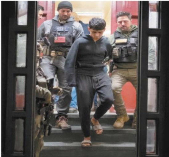
Kristi Noem, titular de Seguridad Nacional estadounidense, informo que entre los detenidos en Nueva York se encontraba el cabecilla de “una violenta banda venezolana”, el Tren de Aragua.