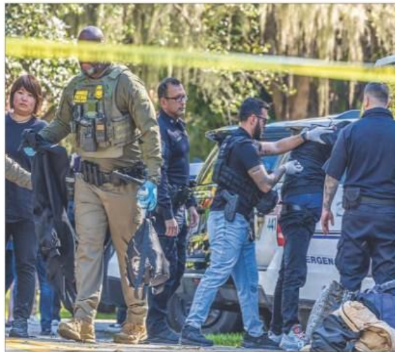
▲ Oficiales de Inmigración, de la DEA y de la Patrulla Fronteriza estadounidenses se lanzaron a la caza de indocumentados en varias ciudades (La imagen en Coral Gables, Florida), incluso con la supervisión