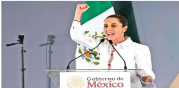
La presidenta Sheinbaum confía en lograr una buena relación con el gobierno de Donald Trump.