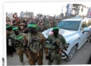
COMBATIENTES de Hamas escoltan vehículo que recogió a rehenes liberadas, ayer.

La hora del capitalismo y el nacionalismo salvaje pág. 23 LEONARDO NÚÑEZ