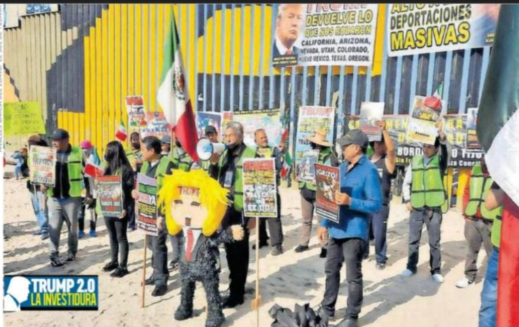
En Tijuana, un grupo de manifestantes se reunieron en la valla fronteriza con una piñata que representa al presidente electo de Estados Unidos, Donald Trump, para protestar contra las medidas de inmigración anticipadas por el republicano.