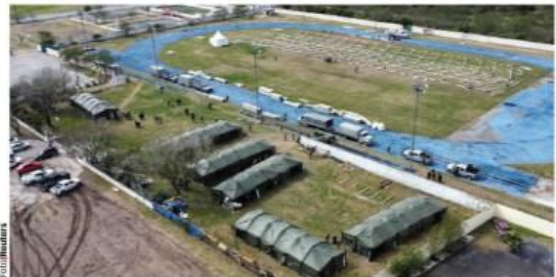
REFUGIO temporal que FA y municipales construyen para migrantes en Matamoros.

NOROÑA admite que hay pendientes más de 60 reformas a leyes secundarias de tipo migratorio; Monreal se dice abierto a que se revise el presupuesto y leyes de respuesta a Donald Trump. págs. 9 y 10