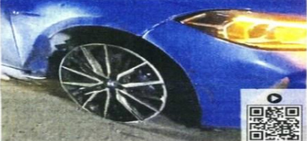
Los delincuentes lanzaron ponchallantas en la vía de cuota en Puebla.