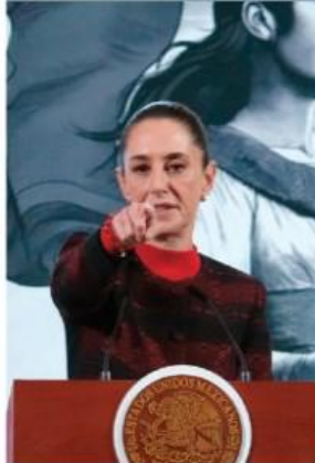
LA PRESIDENTA en conferencia, ayer.