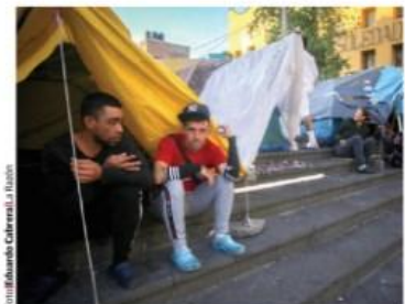
MIGRANTES en Plaza de la Soledad, en el Centro, ayer.

SE ORGANIZAN en Los Ángeles, NY, Chicago, Phoenix...; arman patrullajes para alertarse de posibles redadas; otros tienen miedo y no quieren salir.