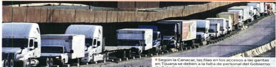
Según la Canacar, las filas en los accesos a las garitas en Tijuana se deben a la falta de personal del Gobierno de Estados Unidos, lo que hace más lentos los cruces.