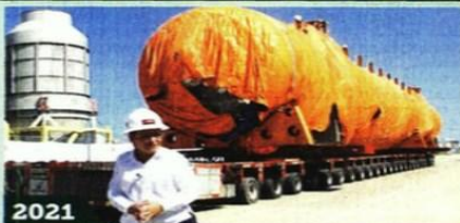
En enero de 2021, la ex titular de Energía, Rocío Nahle, y actual Gobernadora de Veracruz, presumió la llegada de las desaladoras.

"Tan es cierto, que lo dije públicamente, que había un problema de salinidad y Pemex está haciendo todo lo que tiene que hacer para poder resolver el problema", enfatizó.