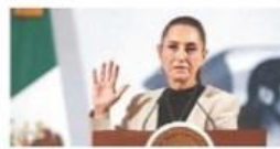
Relevo en la agencia Con la DEA, cooperación sin injerencias: Claudia

"Se establece que las actividades de la empresa y de CFE nunca pueden considerarse monopólicas, ya que la petrolera garantiza la estabilidad del suministro de combustibles", dijo en la conferencia mañanera desde Palacio Nacional, donde la presidenta Claudia Sheinbaum adelantó que ya negocia con los gasolineros para tener un precio no mayor a 24 pesos por litro. PÁGS. 16 Y 17