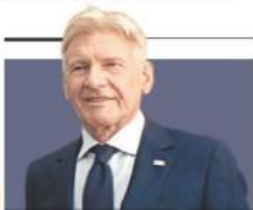
ENTREVISTA Capitán América, "ficción emocional": Harrison Ford

AFP Y EFE, WASHINGTON Y CD. JUÁREZ La Guardia Nacional excava en la frontera con EU, en un tramo de Ciudad Juárez, en busca de túneles del crimen. PAG. 4