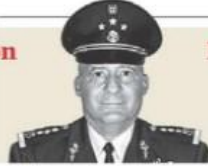
Miguel E. Hernández "La Universidad del Ejército y la Fuerza Aérea, el camino" - P. 11