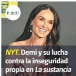
NYT. Demi y su lucha contra la inseguridad propia en La sustancia