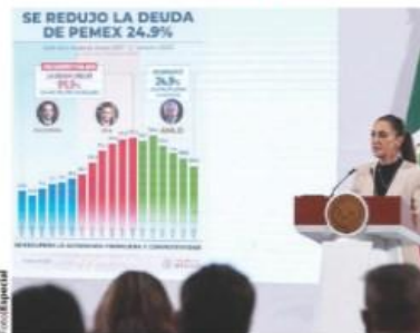
LA PRESIDENTA, ayer, en Palacio Nacional.

INVERSIÓN será de 220 mmdp para 2025-2030; prevé 1.8 mdb diarios; Claudia niega problema de agua y sal en crudo; buscan topa en $24 gasolina. pág. 8