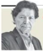
Jorge Zepeda Patterson "La consolidación del liderazgo, proceso inacabado" - P. 9