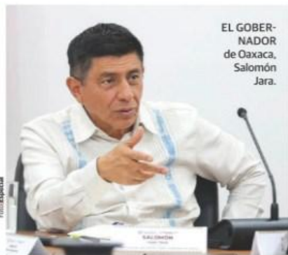
EL GOBERNADOR de Oaxaca, Salomón Jara.