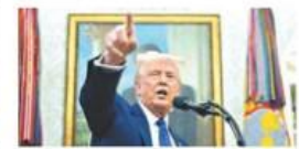
Informe a Zelenski Trump habla con Putin para buscar un acuerdo de paz