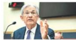
"Hay avances": Powell Rebota a 3% inflación en EU contra todos los pronósticos