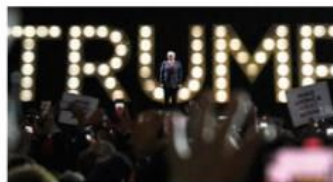
EL MAGNATE, en su discurso en Milwaukee, ayer.

Señala que indocumentados están robando empleos a población negra; en el bando demócrata avizoran que Biden se baje; Obama ya también le plantea reconsiderar pág. 22