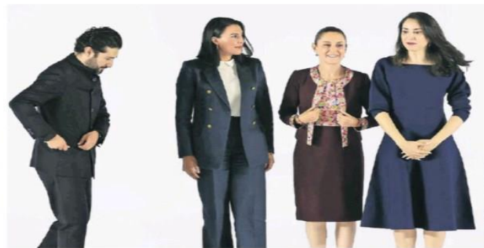
Los tres son jóvenes brillantes, dijo la virtual presidenta electa, Claudia Sheinbaum, de los perfiles seleccionados para ser parte de su gabinete, al presentarlos el día de ayer.