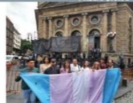
MANIFESTANTES con la bandera trans, ayer, afuera del Congreso de la CDMX.

DONALD TRUMP Candidato republicano a la presidencia de EU