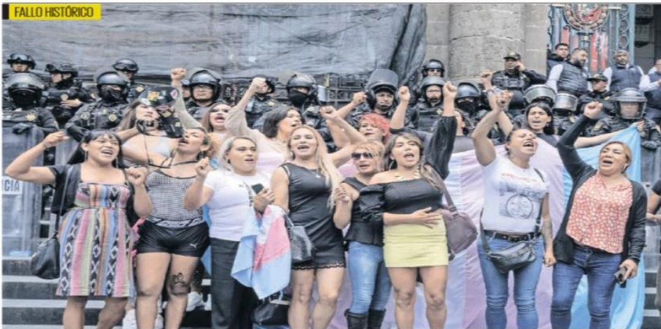
FALLO HISTÓRICO CONGRESO CAPITALINO TIPIFICA EL DELITO DE TRANSFEMICIDIO El Congreso de la CDMX aprobó por 45 votos a favor y uno en contra el dictamen que especifica que comete el delito de transfeminicidio quien, por razón de identidad de género o expresión de género, prive de la vida a una persona cuya identidad de género, real o percibida, esté dentro del espectro femenino. | A18 |