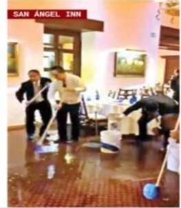
SAN ÁNGEL INN

Caos vial, viviendas, avenidas, comercios y estaciones del Metro anegadas fue el saldo de una tromba vespertina. En Alvaro Obregón, una bajada de agua arrastró varios vehículos y el restaurante San Ángel Inn se inundó. / 24