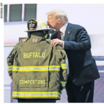
En la convención republicana, Trump presentó el uniforme del bombero que murió en el ataque en Pensilvania. | MUNDO | A14

Mientras el republicano acepta la nominación presidencial y promete poner fin a la "invasión migratoria", la presión crece sobre el mandatario para bajarse de la candidatura demócrata