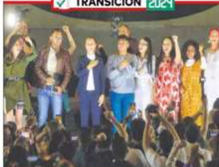
SHEINBAUM. Califica de absurda la idea de que AMLO seguirá gobernando. Si hubiese ganado un hombre no estarían con esa narrativa, dijo.