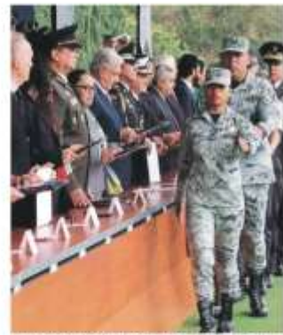
EL PRESIDENTE y el gabinete de Seguridad, ayer.