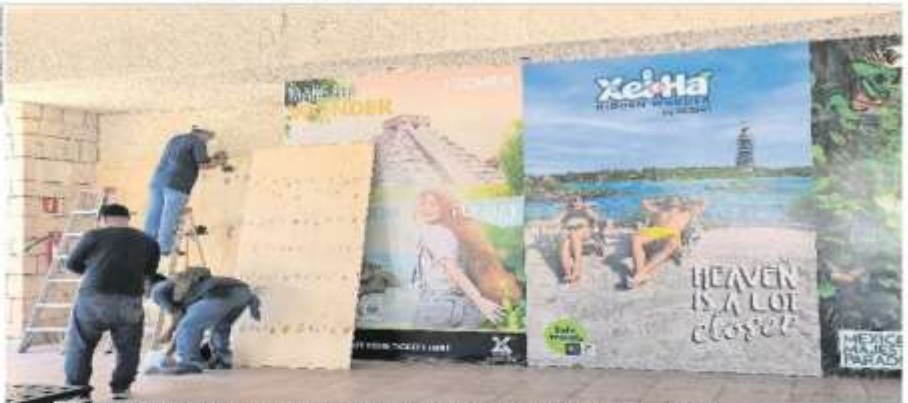
Trabajadores colocan paneles de protección en un embudo de Playa Cancún, en el caso de la zona turística.

HURACÁN DE JA 6 MUERTOS EN EL CARIBE. HOY LLEGA A JAMAICA MUNDO | A12