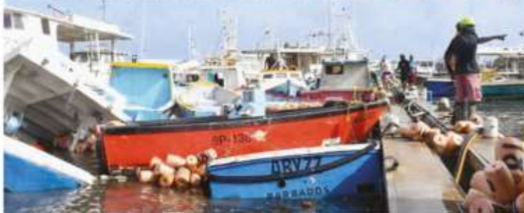
El huracán Beryl deja una estela de destrucción en Barbados y demás islas del Caribe, en su ruta hacia la península de Yucatán. ▶ 13