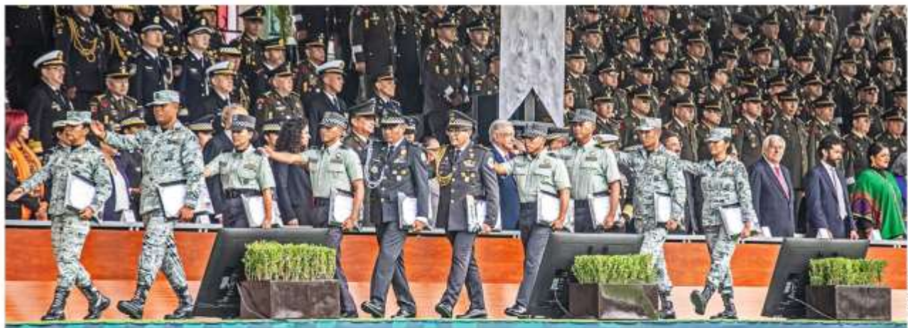
RECONOCIMIENTO. A cinco años de su puesta en marcha, el Presidente destacó el trabajo de la corporación que tiene a su cargo casi la mitad de tareas de seguridad. MÉXICO P. 6

TORTILLERÍAS SE MODERNIZAN; ACEPTARÁN TARJETAS Y COBRO DE SERVICIOS NEGOCIOS P. 15