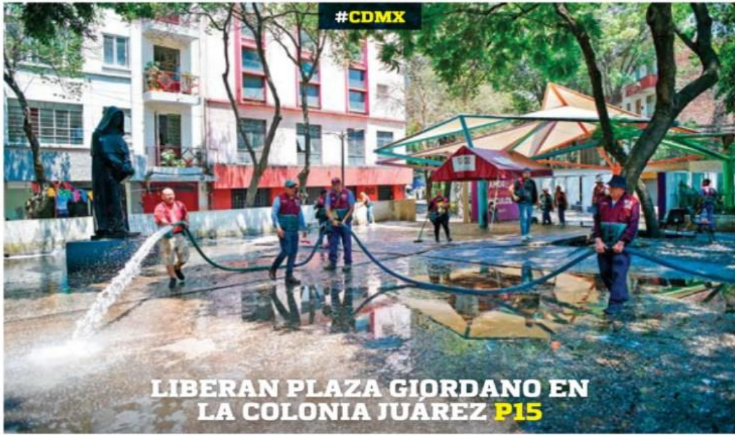
LIBERAN PLAZA GIORDANO EN LA COLONIA JUÁREZ P15

#RADIOGRAFÍA ELECTORAL LOS MAPAS TRAS EL 2 DE JUNIO