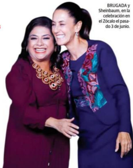
BRUGADA y Sheinbaum, en la celebración en el Zócalo el pasado 3 de junio.

LA ABANDERADA de la 4T a la CDMX con ventaja de 12 puntos sobre Taboada; recibirá constancia el sábado. pág. 6