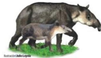
Ilustración: Julio Loyola

Salvar a su especie, misión de los tapires Cayos y Kinich