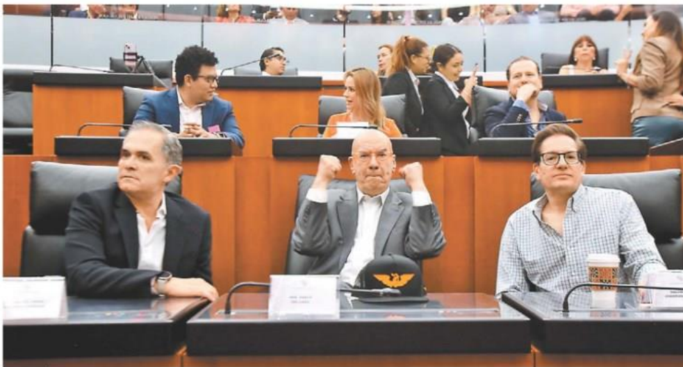
Miguel Ángel Mancera y Salomón Chertorivski flanquean a Dante Delgado Rannauro, quien ensaya La Roqueseñal.