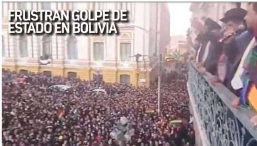
AMLO Y SHEINBAUM REPRUEBAN ALZADA MILITAR. El gobierno boliviano, encabezado por el presidente Luis Alberto Arce, continuó una intención militar liderada por el general Juan José Zúñiga, quien hasta sido destituido recientemente por sus declaraciones respecto a que Evo Morales no puede ser nuevamente presidente y que legado el caso no permitiría que "pilotearan la Constitución". Finalmente Zúñiga fue detenido y encarcelado. El presidente Andrés Manuel López Obrador y Claudia Sheinbaum, Virtual mandataria, reprobaron la acción castrense y firmaron a respetar la democracia. En la imagen, tras la intención, una multitudinal concentración de su apoyo al mandataria boliviano en el Palacio de Gobierno en La Paz. Pág. 14

1 de cada 20 PERSONAS DE 15 AÑOS O MÁS SE SIENTE PARTE DEL GRUPO LGBTTIQ+ P. 3