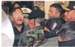
EL PRESIDENTE Luis Arce (de lentes) encara al general rebelde Juan José Zúñiga, ayer.