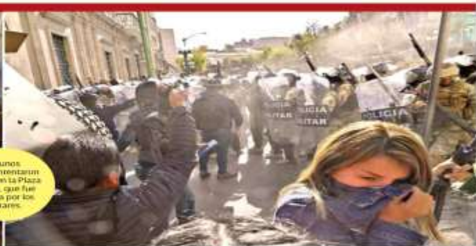
Algunos civiles intentaron resistir en la Plaza Murillo, que fue tomada por los militares.