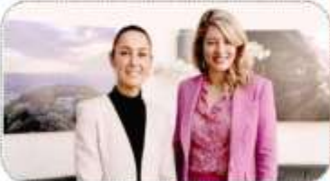
Claudia Sheinbaum y Mélanie Joly P. 6

Sheinbaum se reúne con canciller de Canadá para dialogar futuro del T-MEC