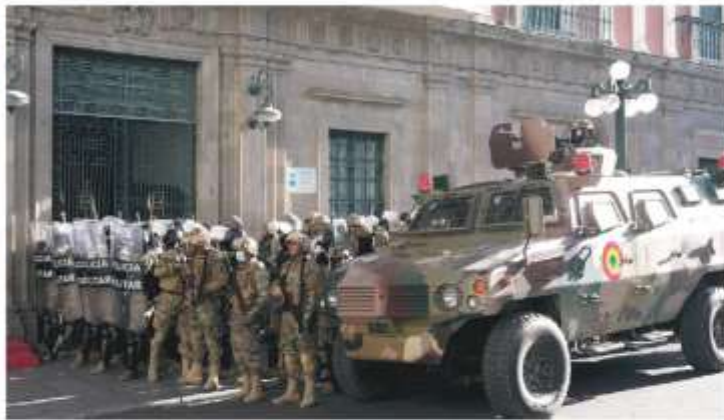
MILITARES llegaron en un tanque a la entrada de la sede del Ejecutivo, ayer, en La Paz.

GENERAL rebelde moviliza tropas, pero termina detenido; lo encara en el Palacio de Gobierno el presidente Luis Arce, quien recibió apoyo de naciones democráticas; el militar alzado sugiere que fue autogolpe. pág. 22