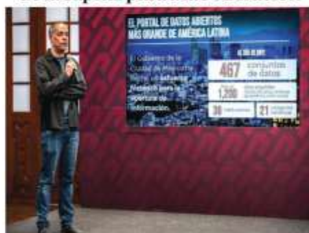
Merino, en imagen de archivo