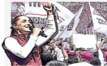
La morenista Sheinbaum gastó principalmente en la organización de eventos masivos y asambleas.