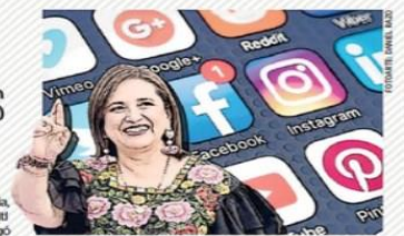
La opositora Gálvez destinó la mayor parte de sus recursos a la propaganda en redes sociales.

En 60 días de precampaña, Claudia Sheinbaum, aspirante de Sigamos Haciendo Historia, desembolsó 38 millones 980 mil pesos; Xóchitl Gálvez, de Fuerza y Corazón por México, erogó 63 millones 171 mil, y Jorge Álvarez Máynez, de MC, 2.8 millones de pesos en 10 días. | A6 |