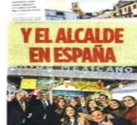
Y EL ALCALDE EN ESPAÑA