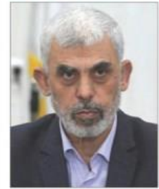
▲ Yahya Sinwar era considerado el cerebro del ataque del 7 de octubre del año pasado que dio inicio a la guerra. Autoridades afirman que falleció en combate y no en una ofensiva aérea dirigida. EU se congratuló del deceso. / P 21 Y 22

“Reglas claras, amistades largas”, mensaje de México a EU: De la Fuente