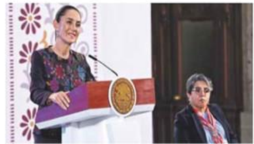
Secretaría Anticorrupción. Asumirá el rol del Inai sin ser juez y parte.