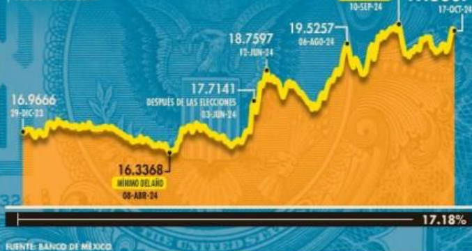
Tipo de cambio en 2024 PESOS POR DÓLAR

El 2024 no ha sido el mejor año para la paridad del peso frente al dólar. En lo que va del año ha prevalecido la volatilidad, pero la tendencia ha sido de depreciación.