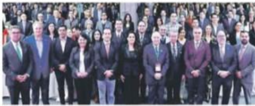
Líderes. Discutieron el futuro del comercio exterior y la inversión en el país.