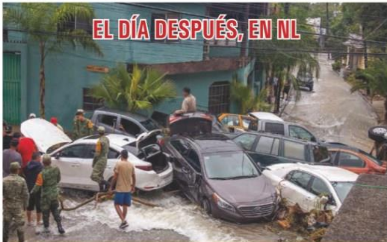
En otoño, una fuerte tormenta colapsó al municipio de Guadalupe, Nuevo León. Decenas de vehículos fueron arrastrados en las faldas del cerro de la Silla. El Ejército Mexicano aplica el Plan DN-III-E para auxiliar a la población. Hay muchos damnificados.