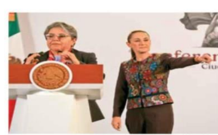
La presidenta Sheinbaum y la titular de la SFP explicaron que se buscará evitar que funcionarios incurran en actos de colusión.