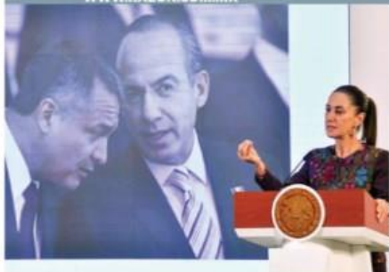
LA PRESIDENTA Claudia Sheinbaum, durante su conferencia mañanera, ayer.