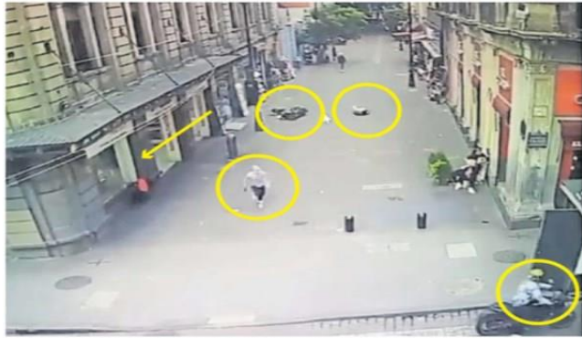
El sicario disparó contra Sánchez, quien iba con dos acompañantes. Uno quedó sobre el piso. La lideresa corrió a una farmacia donde fue alcanzada por el agresor, tras haberla huyó con su cómplice en una moto.

Alumnos acuden a clases en salones sin mantenimiento y con instrumentos viejos. | A25 |