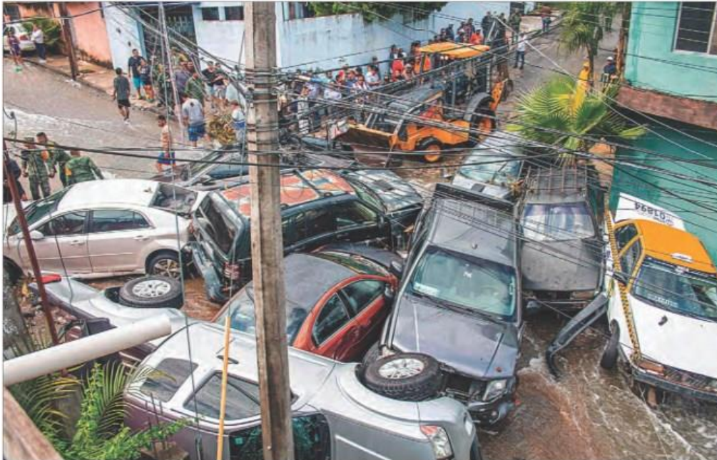
▲ La fuerte precipitación ocasionada por el frente frío número 4, que azotó la noche del miércoles y madrugada del jueves a la zona metropolitana de Monterrey, provocó severas inundaciones en el municipio de Guadalupe por el desbordamiento de una represa

Torrencial lluvia deja 3 fallecidos y arrastra autos en NL