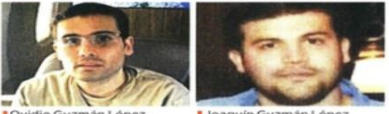
Ovidio Guzmán López. Joaquín Guzmán López.