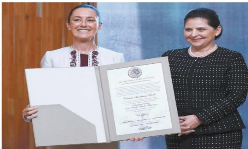
Mónica Soto, magistrada presidenta del Tribunal Electoral del Poder Judicial, entregó la constancia que acredita a Claudia Sheinbaum como ganadora de los comicios presidenciales del 2 de junio, lo que la convierte en la primera presidenta electa de México.