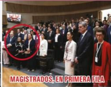
MAGISTRADOS, EN PRIMERA FILA

Claudia Sheinbaum, tras enviar su mensaje como primera presidenta electa de México. Antes, en la ceremonia de entrega de constancia en la sede del TFPJF, Norma Piña, presidenta de la Suprema Corte, en el círculo rojo, estuvo en primera fila, pese a que dentro de 72 horas trabajadores del PIF amenazan con iniciar un paro nacional. ▶ 7