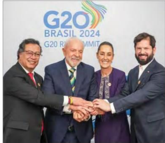
▲ La mandataria se encontró con Gustavo Petro, de Colombia; Luiz Inácio Lula da Silva, de Brasil, y Gabriel Boric, de Chile.

imágenes). Asimismo, con los mandatarios de Estados Unidos, Canadá, Vietnam, Indonesia, Corea, Turquía y Australia. ALMA E. MUÑOZ, ENVIADA / P 3 Y 4