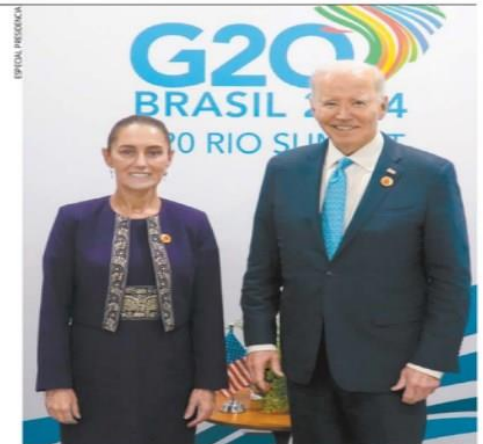
Claudia Sheinbaum y Joe Biden hablaron de la buena relación que hay entre México y EU, así como de la importancia del trabajo conjunto.