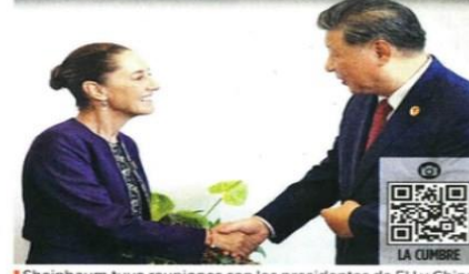
Sheinbaum tuvo reuniones con los presidentes de EU y China.