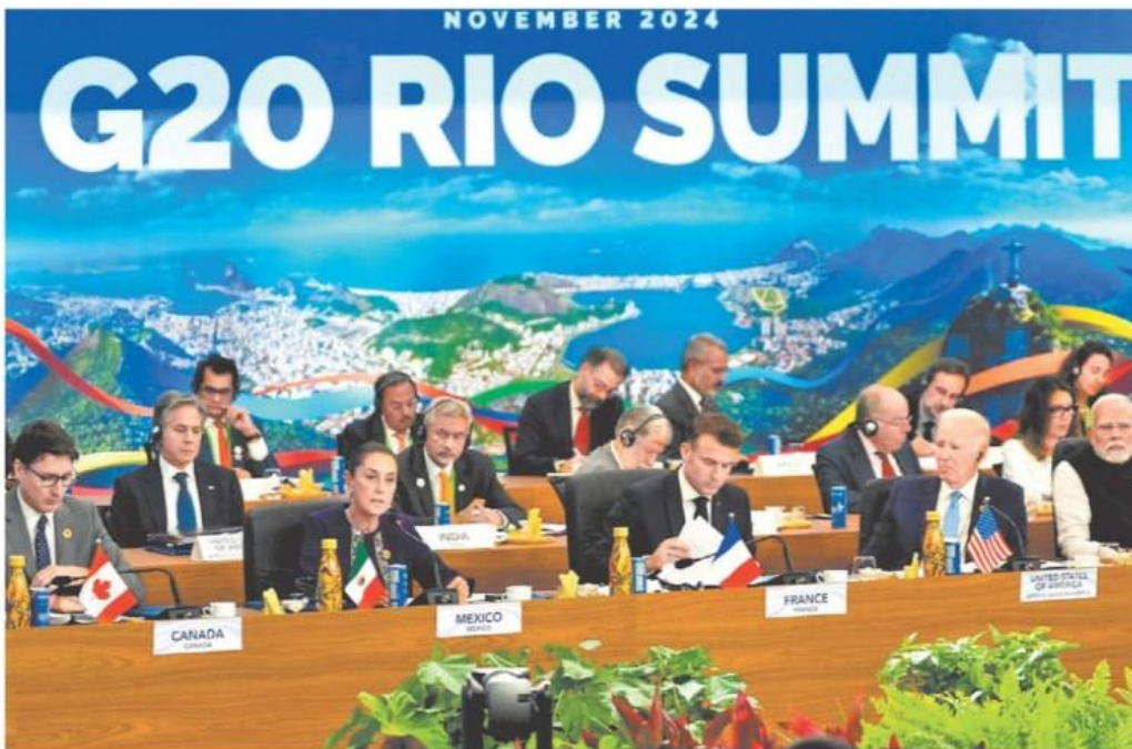
Los líderes de Canadá, México, Francia, Estados Unidos e India durante el encuentro en Brasil. ESPECIAL