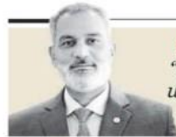
Haitham Al Ghais "Es falso el dilema de una lucha petróleo vs. electricidad" - P. 34