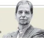
Agustín Basave "La supermayoría devino supremacía constitucional" - P. 12

Crimen. La SSP estatal detecta en Juárez operaciones de El Tren de Aragua ligadas al tráfico de migrantes y resalta el bajo perfil con el que se manejan sus integrantes