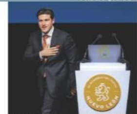
SAMUEL García, ayer, en su tercer informe.

También se reporta participación en secuestros y en éxodos del Tren de Aragua, un grupo venezolano; la semana pasada 10 guatemaltecos y un salvadoreño fueron detenidos tras enfrentamientos en Tecpan