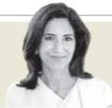
Rana Foroohar "Mujeres, clave en la elección del próximo presidente de EU" - P. 38