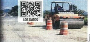
Los daños en el Viaducto Diamante de Acapulco han sido reparados provisionalmente.

tor turístico sostienen que ambos temporales han causado una grave crisis, pues los visitantes se han alejado de Acapulco. De las 20 mil habitaciones que hay en el puerto, apenas 11 mil se habían rehabilitado tras los estragos causados por "Otis", y luego con "John" empeoró la situación.