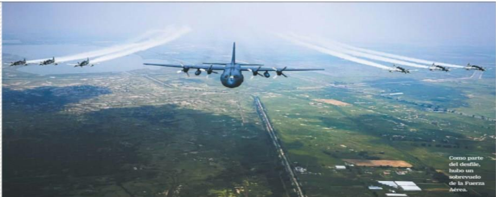
Como parte del desfile, hubo un sobrevuelo de la Fuerza Aérea.

Durante el desfile militar para conmemorar la Independencia, las Fuerzas Armadas despidieron a Andrés Manuel López Obrador y ofrecieron compromiso, subordinación, respeto y lealtad a su próxima comandante suprema, Claudia Sheinbaum. Los secretarios de Defensa y Marina destacaron que soldados y marinos están listos para enfrentar los retos y cumplir las órdenes. | NACIÓN | A6