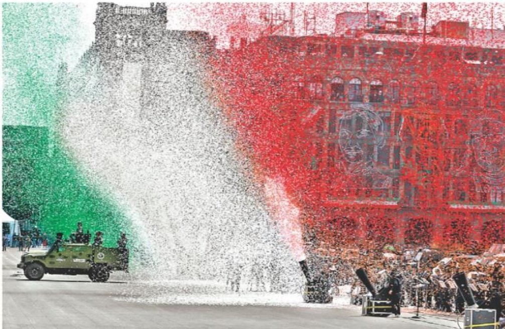
Sorpresas en tierra y aire durante la exhibición de las fuerzas armadas y su recorrido del Zócalo al Campo Marte.

Zoé Robledo "Avanzamos a una ruta de planeación como en Dinamarca" - P. 12