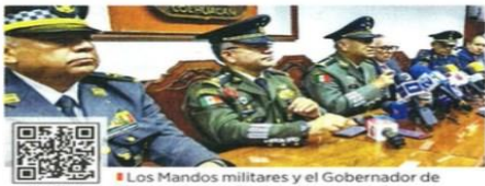
Los Mandos militares y el Gobernador de Sinaloa, Rubén Rocha, dieron un informe.

"La seguridad depende de estos grupos delincuenciales", se le insistió. "Depende de ellos, son los que hacen las agresiones y los que están cobrando vidas; nosotros no, al contrario, estamos acá para evitar que tengan confrontaciones y haya pérdidas de vidas humanas", respondió.