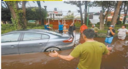
LES CAMAROS EL UNIVERSAL