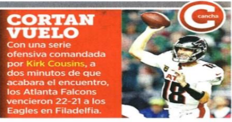
CORTAN VUELO Con una serie ofensiva comandada por Kirk Cousins, a dos minutos de que acabara el encuentro, los Atlanta Falcons vencieron 22-21 a los Eagles en Filadelfia.