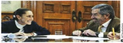
Acompañada del Canciller Juan Ramón de la Fuente, Sheinbaum tuvo ayer una llamada con Trump.

"Abordamos la estrategia mexicana sobre el fenómeno de la migración y compartí que no están llegando caravanas a la frontera norte porque son atendidas en México", explicó la Presidenta tras la comunicación, en la que estuvo acompañada