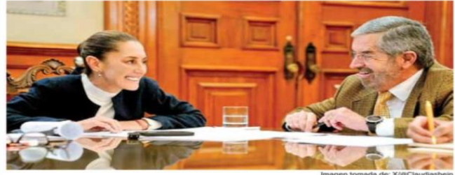
La presidenta Claudia Sheinbaum y el canciller Juan Ramón de la Fuente, durante la llamada de ayer con Donald Trump, mandatario electo de Estados Unidos, en la que dialogaron sobre migración.