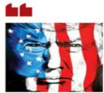
DONALD J. TRUMP @realDonaldTrump

En nuestra conversación con el presidente Trump, le expuse la estrategia integral que ha seguido México para atender el fenómeno migratorio, respetando los derechos humanos. Gracias a ello se atiende a las personas migrantes y a las caravanas previo a que lleguen a la frontera. Reiteramos que la postura de México no es cerrar fronteras sino tender puentes entre gobiernos y entre pueblos.