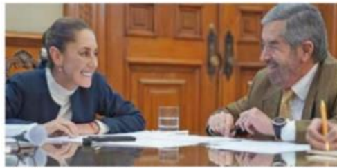
Puente de entendimiento. Sheinbaum y Trump ponderan conversación telefónica.