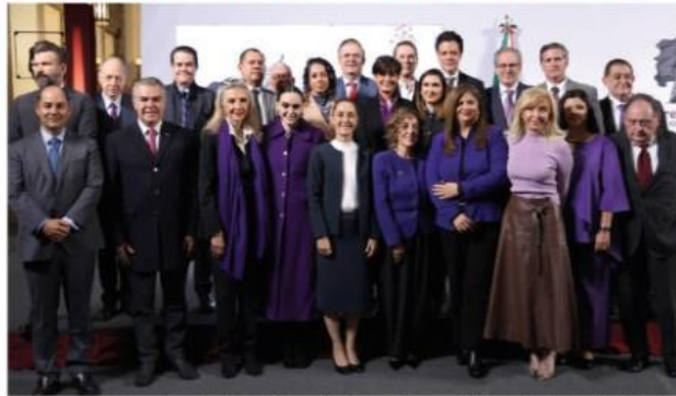
LA PRESIDENTA con los miembros del Consejo Asesor de Desarrollo Económico y Relocalización.