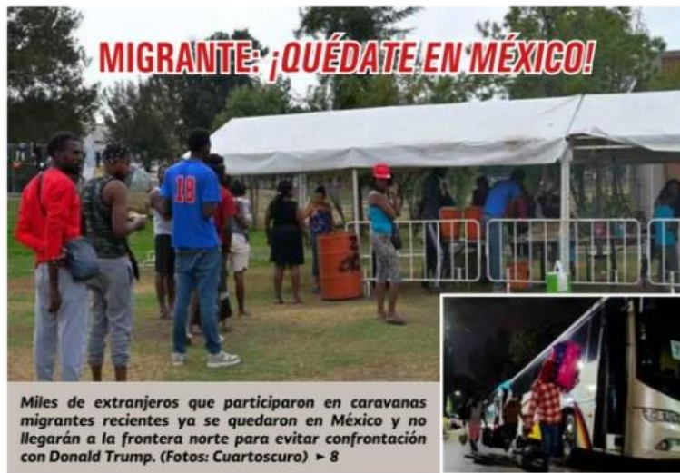
Miles de extranjeros que participaron en caravanas migrantes recientes ya se quedaron en México y no llegarán a la frontera norte para evitar confrontación con Donald Trump. ▶ 8

Por Carlos Ramírez / Indicador Político ▶ 3 y 4