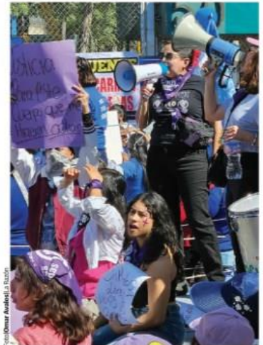
PROTESTA afuera del Reclusorio Oriente durante audiencia de exestudiante del IPN.

JUEZ fija audiencia de Diego "N" para el 4 de diciembre; es acusado por delito contra la intimidad; modificaba imágenes de compañeras y las vendía; afuera del reclusorio, mitines a favor y en contra. pág. 22