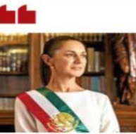
CLAUDIA SHEINBAUM PARDO @Claudiashein