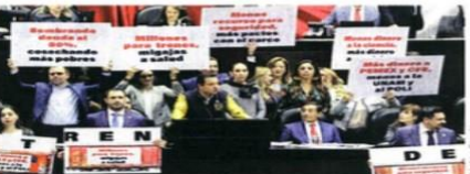
La Oposición reprochó al titular de Hacienda, los recortes en Salud y Educación.

En cuanto a la inversión, confió en que será potenciada por proyectos con la iniciativa privada y la relocali-