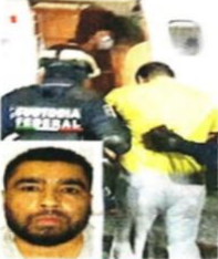
LO QUIERE EU. "El Contador" fue detenido en febrero de 2022.

Autoridades penitenciarias informaron que ayer mismo, el jefe de "Los Escorpiones" abandonó el Reclusorio Oriente de la Ciudad de México, donde estaba preso desde febrero de 2022.