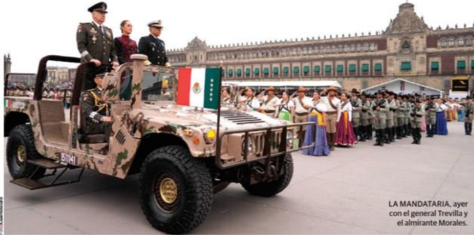
LA MANDATARIA, ayer con el general Trevilla y el almirante Morales.

SHEINBAUM destaca en el 114 aniversario del inicio de la Revolución las transformaciones; asegura que México es visto con admiración en el mundo; destaca apoyo de Fuerzas Armadas en seguridad y obras; éstas refrendan lealtad a la Presidenta y a la nación; cientos de familias aplauden a contingentes. pág. 12