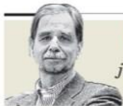
Agustín Basave "El sometimiento judicial en tiempos de Zaldívar" - P. 17