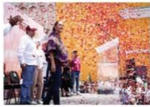
CLAUDIA SHEINBAUM, ayer en Chiapas.

ABANDERADA de la 4T propone frontera industrializada; cada año cruzan por Tapachula un millón de indocumentados; ofrece ir por reconocimiento de pueblos originarios. pág. 8