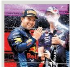
Checo Pérez, octavo mejor piloto de F1

El mexicano subió al podio en el Gran Premio de China y superó en puntos al histórico Schumacher