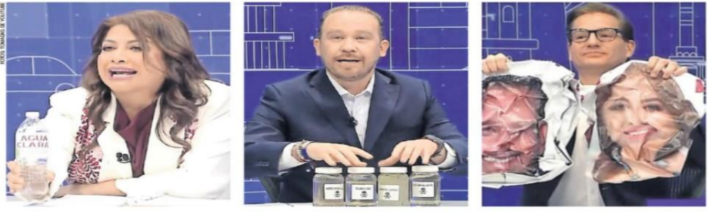
CUATRO COLUMNISTAS DE EL UNIVERSAL VEN GANAR A TABOADA, TRES A CHERTORIVSKI Y DOS A BRUGADA