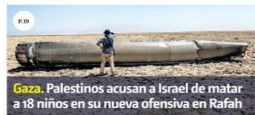
Gaza. Palestinos acusan a Israel de matar a 18 niños en su nueva ofensiva en Rafah