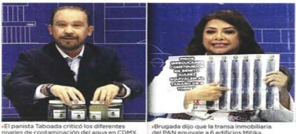
El panista Taboada criticó los diferentes niveles de contaminación del agua en CDMX.

Taboada invitó a Brugada y a su familia a bañarse con el agua contaminada, no sólo de Benito Juárez, si no también,