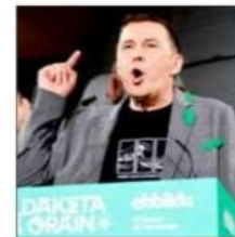
▲ Arnaldo Otegi, líder de la alianza de izquierda EH-Bildu, ofrece un discurso del avance electoral de la coalición en esa región.