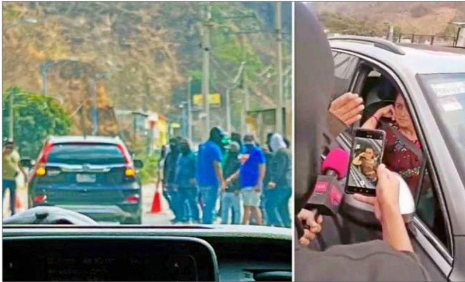
▲ La camioneta en la que viajaba Claudia Sheinbaum, candidata de la coalición Sigamos Haciendo Historia, fue detenida por un grupo de embozados en un retén colocado en la localidad chiapaneca. Ella bajó una ventanilla para escucharlos. “Queremos que, cuando sea presidenta, nos haga favor de limpiar este tramo de Comalapa”, dijo uno y otro grabó, a escasos centímetros de la morenista, un