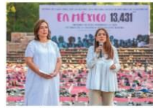
XÓCHITL GÁLVEZ, ayer en Michoacán.

CANDIDATA ofrece hacerse cargo de los que quedaron huérfanos en pandemia o por el asesinato de sus madres; ofrece a migrantes mexicanos: serán considerados "el estado 33". pág. 8