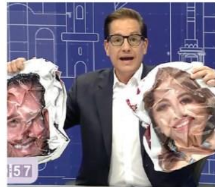
LOS CANDIDATOS Santiago Taboada, Clara Brugada y Salomón Chertorivski, anoche, durante el debate organizado por el IECM.