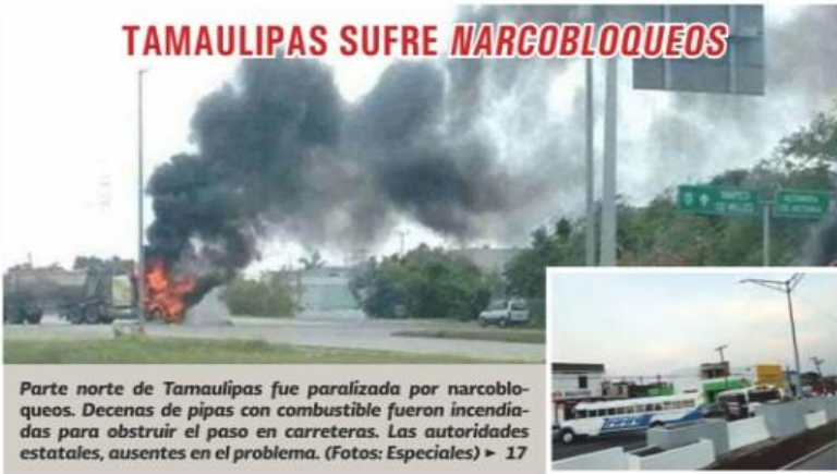
Parte norte de Tamaulipas fue paralizada por narcotráficos. Decenas de pipas con combustible fueron incendiadas para obstruir el paso en carreteras. Las autoridades estatales, ausentes en el problema. ▶ 17