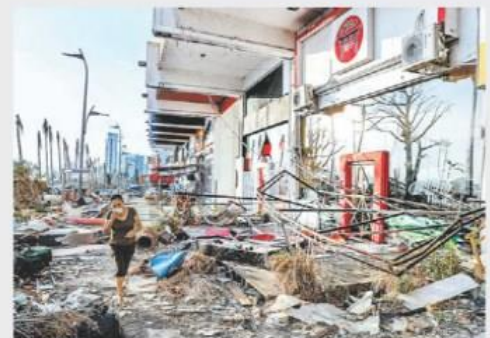
El gobierno declaró fin de la emergencia.