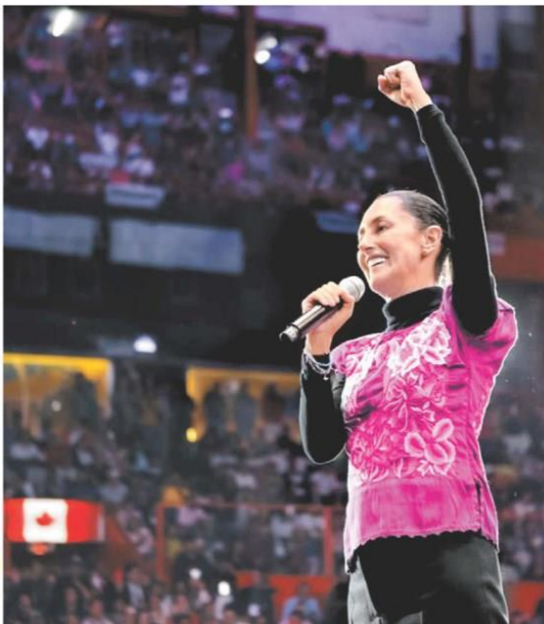
La aspirante presidencial pidió a los competidores cerrar filas por la transformación. ESPECIAL

"Nos encontramos en la libertad": Hadassah Modelo mexicana trans