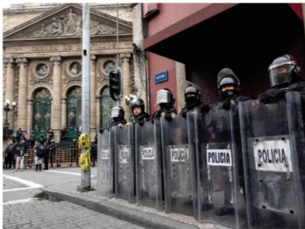
POLICÍA capitalina blindó ayer la Cámara de Diputados local.

Oradores de la 4T hacen tiempo para no llegar a la votación que sería adversa; PAN acusa "machincuepas"; retomarían discusión en periodo extra pág. 16