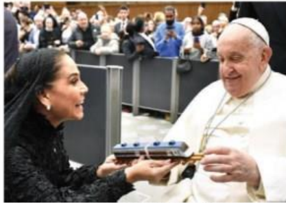
ELPAPA Francisco, con la gobernadora de Quintana Roo, ayer.

ENTREGA gobernadora de Q.Roo al Pontífice carta de AMLO y una réplica del ferrocarril que será inaugurado mañana; realiza gira en Italia para promover turismo en su entidad. pág. 10