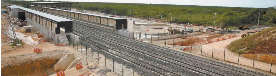
Pobladores y activistas señalan que el presidente López Obrador sólo inaugurará las vías, porque estaciones, como la de Calkiní, todavía no están terminadas.

hecho por EL UNIVERSAL, se constató que hay vías inconclusas y señalética faltante. En las estaciones y vías se carece de infraestructura peatonal, ciclista y de accesos, así como de instalaciones y escaleras eléctricas. | A4 Y A5 |