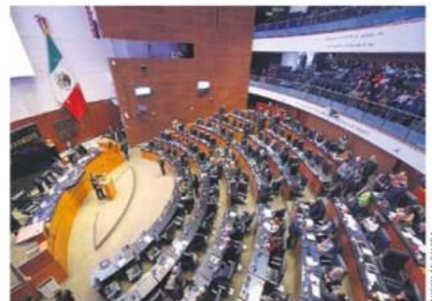
Sin acuerdos. Rechazan la segunda terna para sustituir a Arturo Zaldívar.

su voto al nombramiento de dos magistrados electorales que están pendientes. Tras el rechazo de la segunda terna, ahora —según la Constitución— el presidente deberá designar ministra a alguien de esta terna. —Eduardo Ortega/PÁG. 38