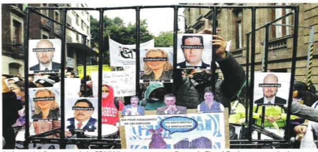
Afuera del Congreso de la CDMX llegaron grupos afines a la Fiscal Godoy para protestar contra los legisladores de Oposición.

Posponen hasta febrero decisión; cierran opositores filas contra Morena EDUARDO CEDILLO Las intenciones de Morena por prolongar hasta 2028 el mandato de Ernestina Godoy en la Fiscalía de la CDMX chocaron con una cortina opositora. Ayer, de una forma inusitada para una Legislatura caracterizada por el ausentismo, los 66 diputados locales estuvieron presentes y a tiempo para la sesión ordinaria, la penúltima del actual periodo. Luego de que se presentó el dictamen ante el Pleno, comenzó la discusión, con los morenistas centrando su alegato alrededor de las acciones de Godoy contra panistas implicados en la corrupción inmobiliaria en la Alcaldía Benito Juárez. La estrategia guinda era alargar el debate para tratar de ganar votos mientras que los opositores urgían a votar el nombramiento. "Que sepa la ciudadanía, (aquí) de frente a la ciudadanía que queda de constancia que esta Oposición en la ciudad hoy los dobló, hoy quedaron de rodillas, no reunieron los votos", reclamó el panista Ricardo Rubio.